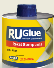
Kemasan Kaleng 400gr